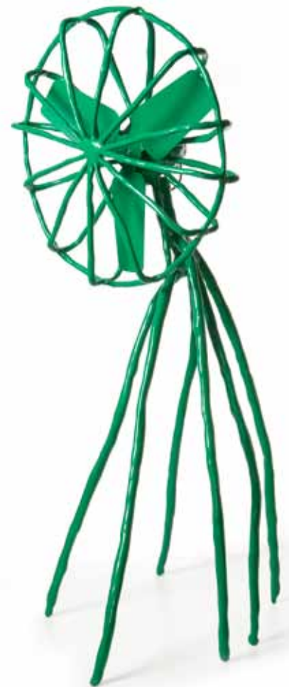
Clay Furniture, 2006