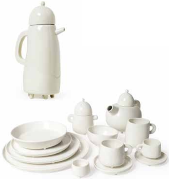
The Haphazard Harmony, 2009 Servies, productie: Skitsch, foto: Met dank aan Skitsch

Van kleine schetsen zijn met de hand PUR-schuim modellen van het serviesgoed gemaakt, die dienen voor de matrijs. Voor elk onderdeel van het servies zijn zes verschillende modellen gemaakt, waardoor eenvormigheid vermeden wordt.