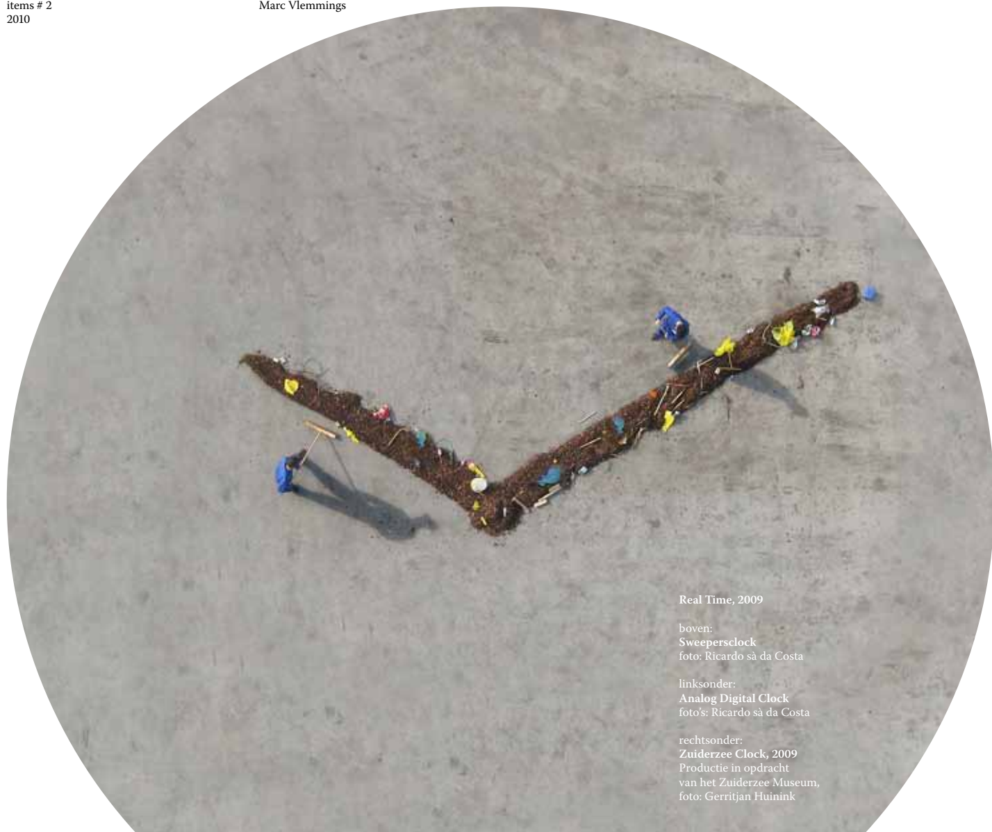
Real Time, 2009

boven: Sweepersclock