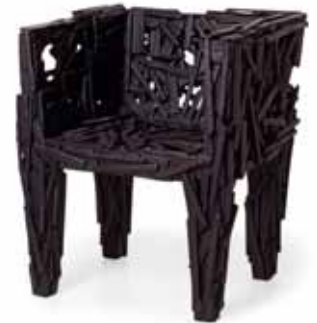
Where There's Smoke, 2004

Favela stoel ontwerp: Fernando Campana en Humberto Campana, productie: Moss