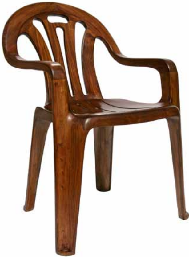
Made in China, 2008 Monoblock tuinstoel in hout uitgevoerd

“Zodra een idee er is begint het een eigen leven te leiden in de werkplaats. In dat proces ben ik de regisseur.”