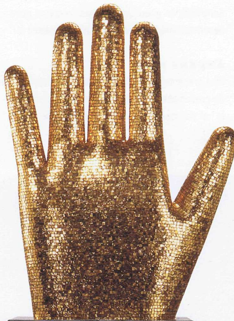
Alessandro Mendini: kabinet, bladgoud/glasmozaiek, Bisazza

De geijkte trekker uit het gonscircuit is de locatie van Ron Arad en Ingo Maurer. Wat er te zien was blonk uit in expressie. Maar het was tegelijk niet echt baanbrekend. Ron Arad had er talloze varianten staan van de stoel Domus die bij Vitra in productie gaat.