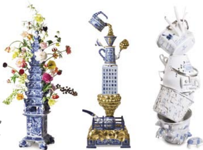
Iriuscipis accum zzrit lamconulla facil utpat aliquamet, consed min

vergelijkbaar project, dat de publieksprijs voor het populairste project kreeg uitgereikt: de ontwerpers van The Daily Gorilla reageerden de afgelopen jaren op dagelijkse nieuwsgebeurtenissen door ze op de voorpagina en de website van de Volkskrant in grafische vignettes te vertalen. De afbeeldingen zijn geestig en soms schrijnend – een kaart van Afrika samengesteld uit de woorden ‘honger’ en ‘oorlog’, of een multiple-choice menu van soundbites voor politici – maar de beperkte tijd gaf de ontwerpers geen mogelijkheid om hun ideeën verder te polijsten en te overdenken. Het succes van de vignettes berustte veeleer op toeval – en op grondige kennis van de postercultuur van de jaren zestig – dan op serieus ontwerpwerk.