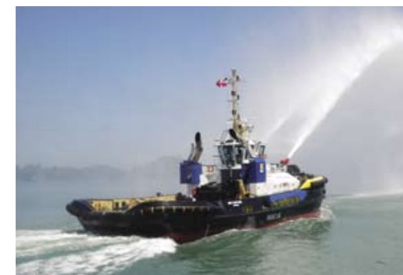
Iriuscipis accum zzrit lamconulla facil utpat aliquamet, consed min er sum nullaore mincing aciduisl incilis diat.