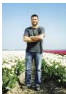
Iriuscipis accum zzrit lamconulla facil utpat aliquamet, consed min er sum nullaore mincing aciduisl incilis diat.