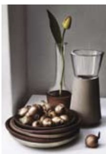
Iriuscipis accum zzrit lamconulla facil utpat aliquamet, consed min er sum nullaore mincing aciduisl incilis diat.